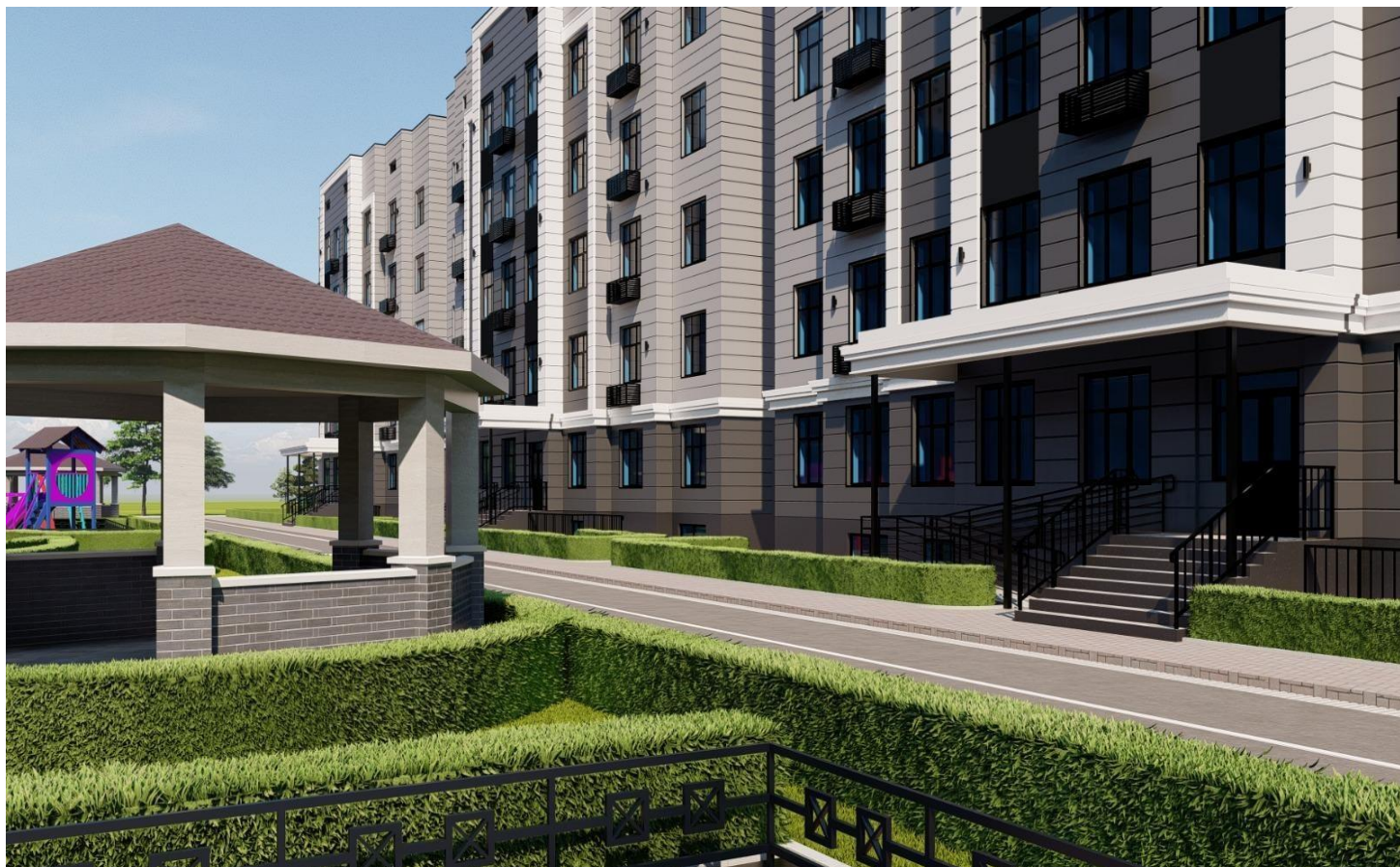
Визуальный вид 3D