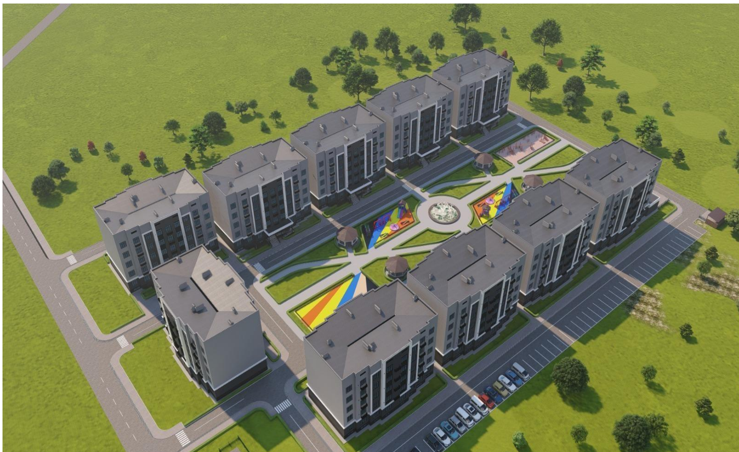
Визуальный вид 3D